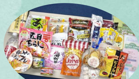
前回配付の食品（一例）