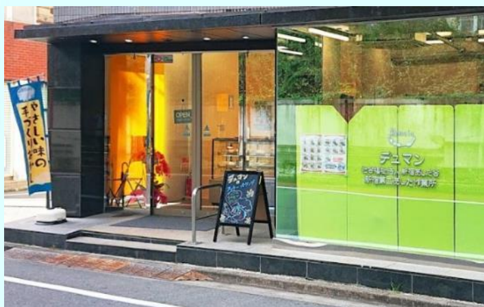
↑ 新しい第二あした作業所

建物が早稲田大学の近くということもあり、学生さんをはじめ、近所の方々、常連さんが足を運んでくださいます。作業所のみなで、おいしいクッキーを作っていきます！これからも、第二あした作業所をよろしくお願い致します。