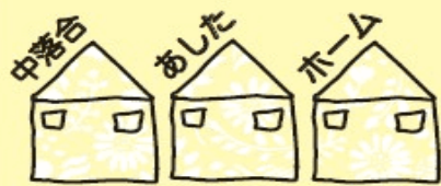
Nakaochiai Ashita Home